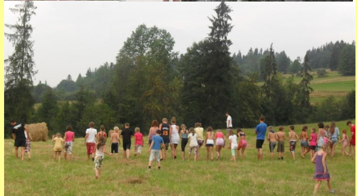
Gra terenowa 3 - z wodnymi balonami – uczymy się współpracy i wzajemnej pomocy w grupie.