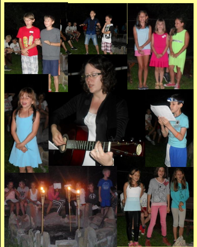
Festiwal Piosenki Wakacyjnej. Sprawność Śpiewaka