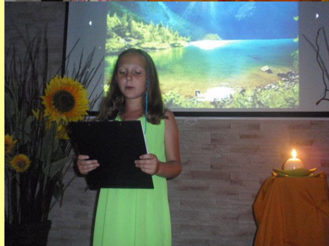
Konkurs recytatorski – poezja Jana Pawła II, ks. J. Twardowskiego, Poezja dziecięca