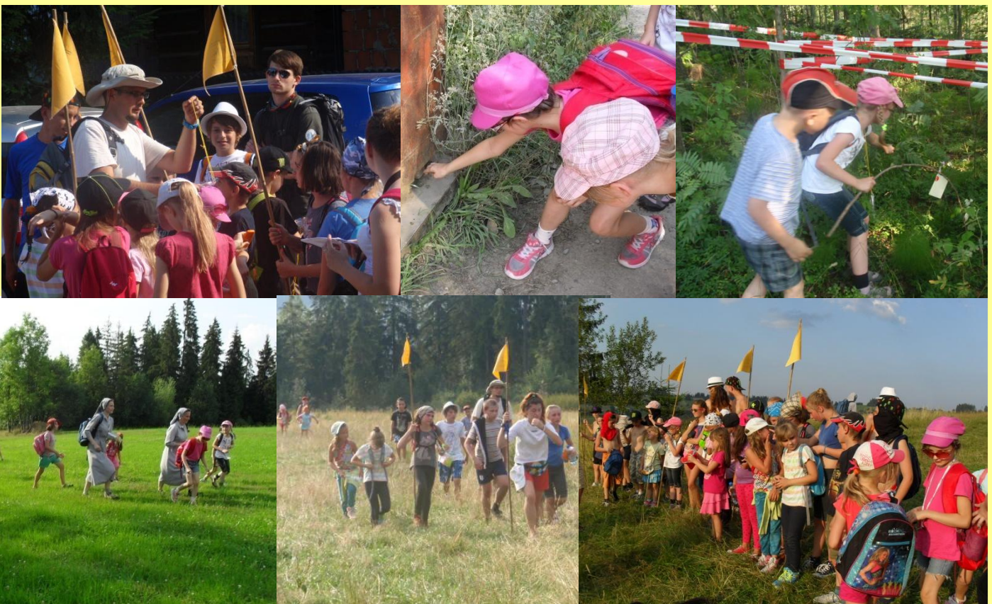
Gra terenowa 2 – dla pięciu grup – dotrzeć do celu, na szczyt góry, za pomocą zaszyfrowanych wiadomości, mapy i kompasu. Sprawność walczącego obozowicza