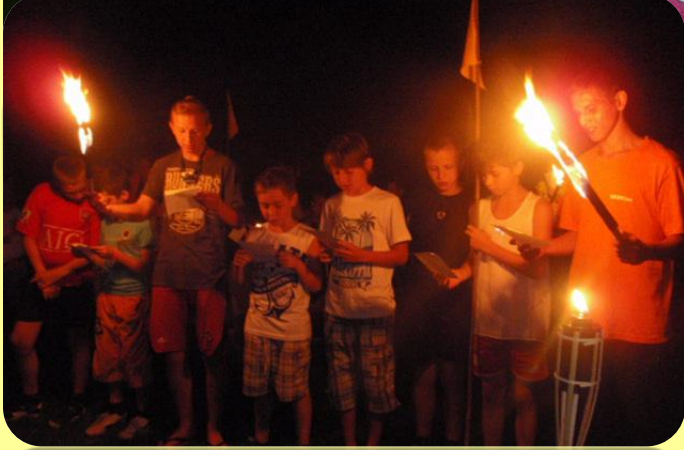
Przyrzeczenie obozowe przy pochodniach, wręczenie koszulek – zobowiązujemy się publicznie i uroczyście do dobrego przeżycia wakacji!