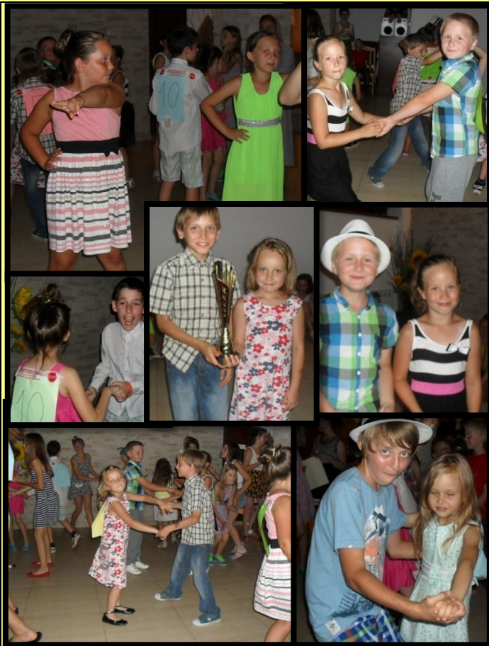
Wakacyjny Konkurs taneczny – wyłonienie Zwycięzców. Sprawność Tancerza