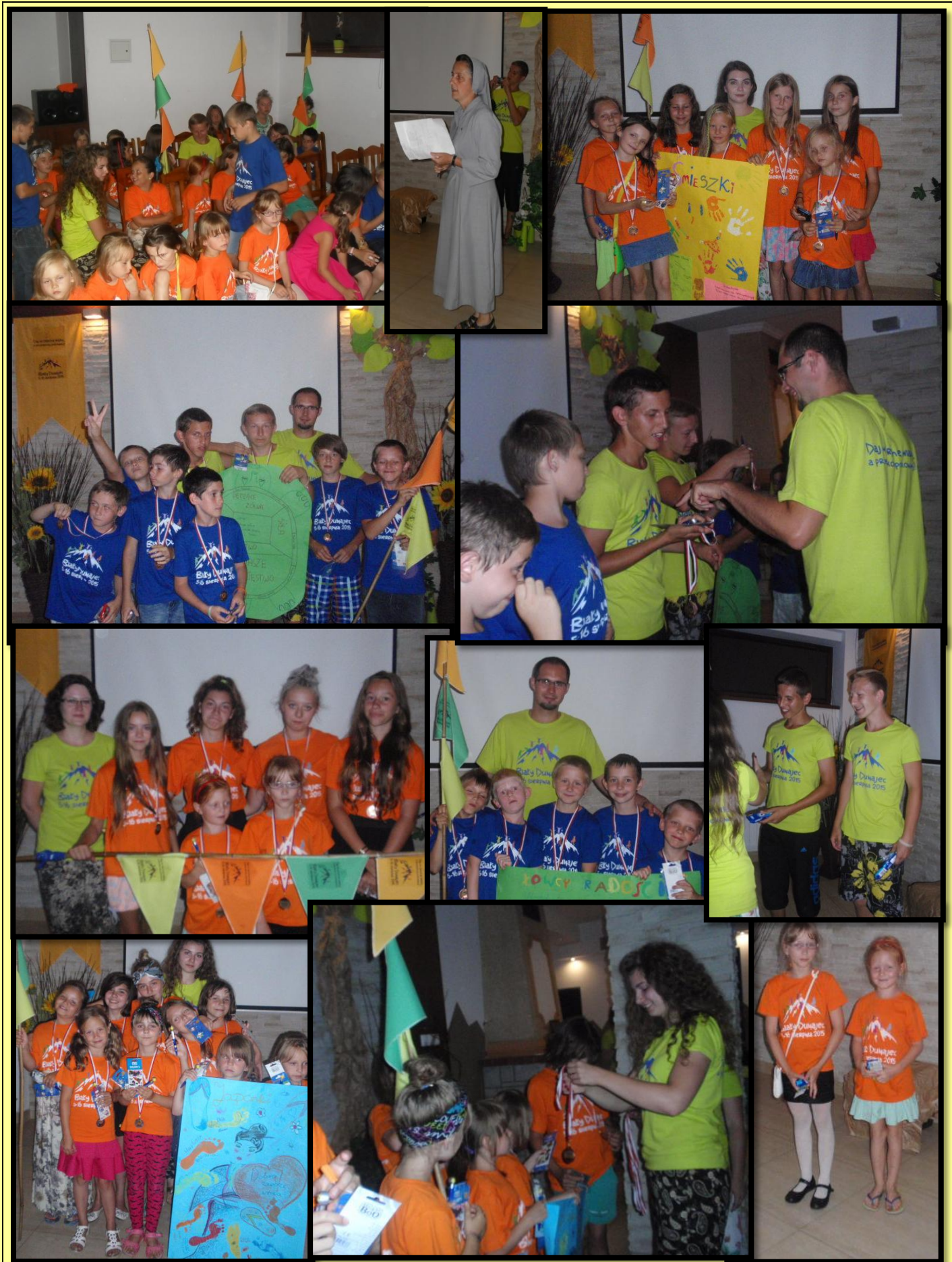
Podsumowanie kolonii, nagrody, wyróżnienia