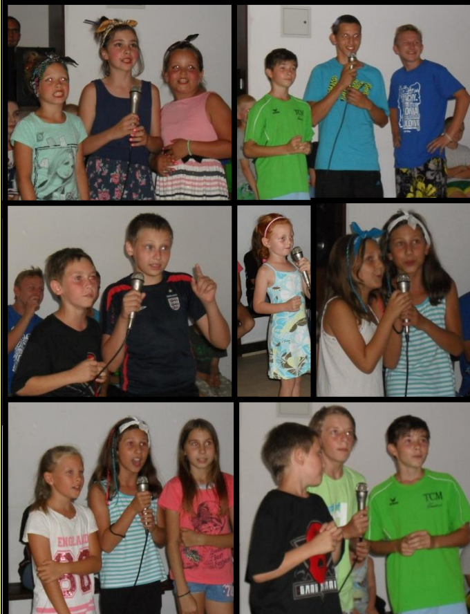
Karaoke – odkrywamy umiejętności i talenty Sprawność śpiewaka z tekstem