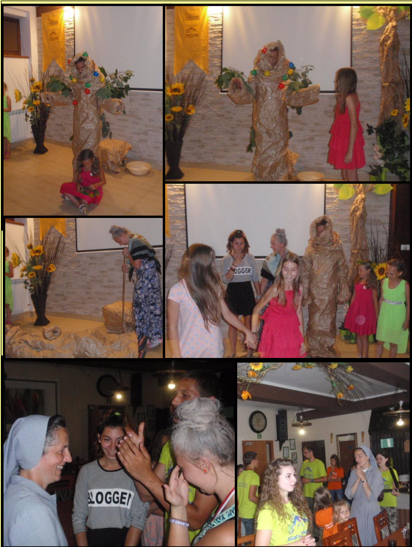
Podziękowanie dla Wychowawców, z dedykacją przedstawienia „Szlachetne drzewo”