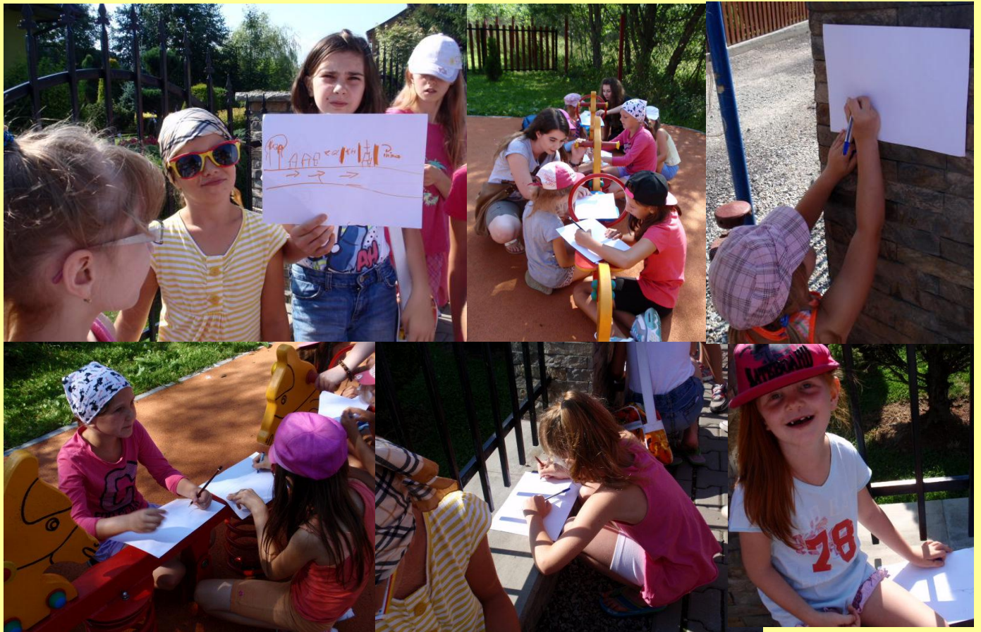
Gra terenowa 1 – sporządzenie planu sytuacyjnego Białego Dunajca, Sprawność Geografa