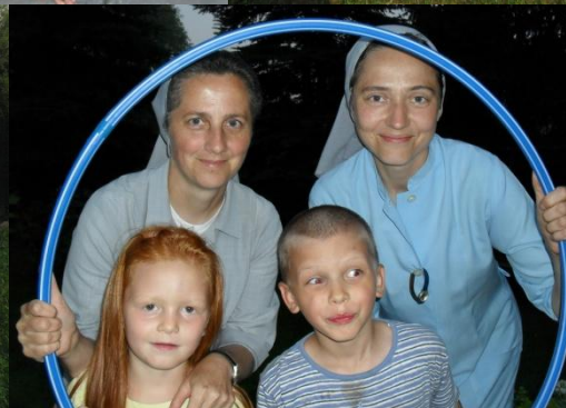
Gry i zabawy rekreacyjne.