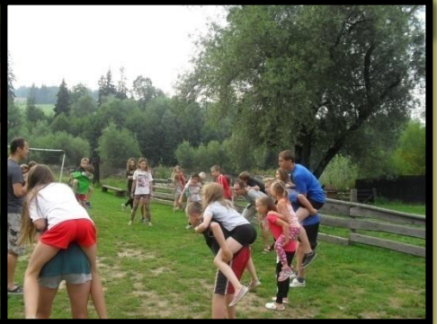
Gimnastyka poranna zaprawiająca do walki na cały dzień!