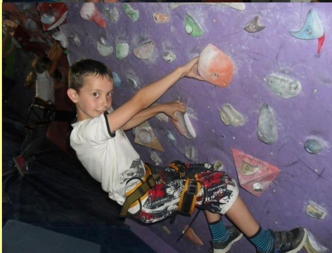
Zajęcia na ścianie wspinaczkowej – ćwiczymy kondycję i silną wolę