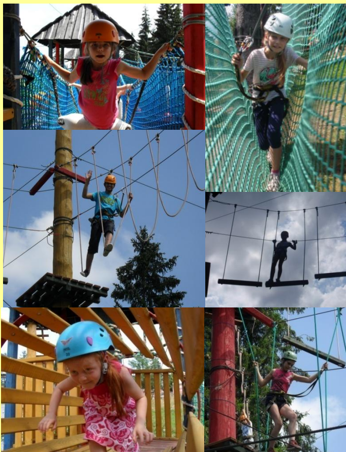
Zajęcia sportowe w Parku Linowym