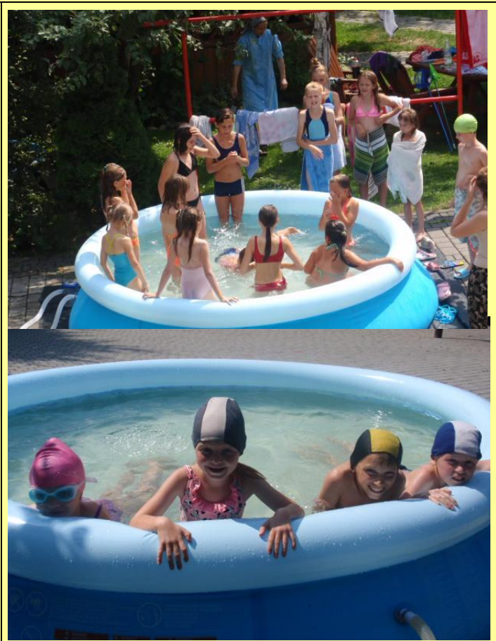
Basen ogrodowy, plażowanie