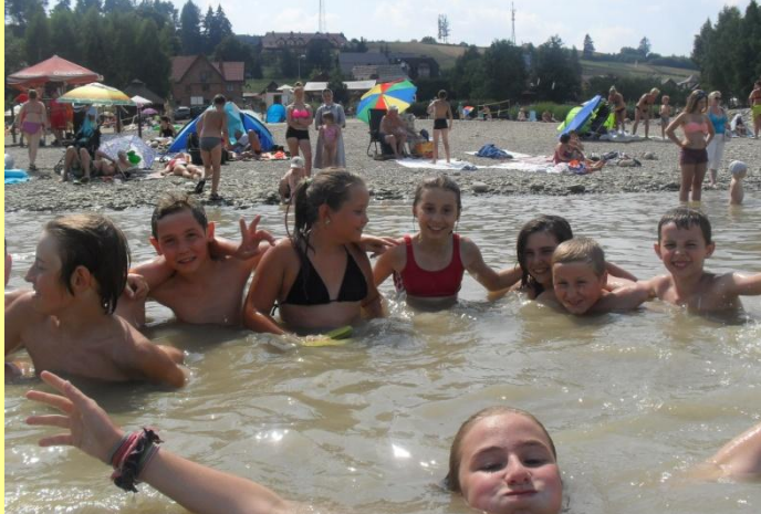
Wycieczka do Niedzicy, zajęcia wodne z ratownikiem