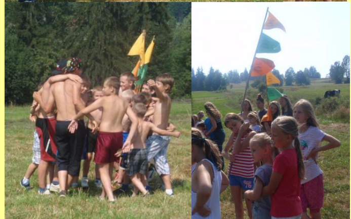
Gra terenowa 4 – międzygrupowe zdobywanie proporcy